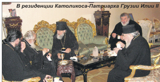
В резиденции Католикоса-Патриарха Грузии Илии II

«Когда икону поставили в киот, глаз невозможно было оторвать от этой красоты. В киот были вложены частицы чудотворных мощей святых мучеников. Я попросил Евгения сделать просто небольшую рамочку. Но он соорудил, хоть и очень красивый, но такой мощный и тяжелый киот, что я схватился за