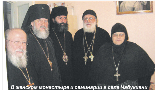
В женском монастыре и семинарии в селе Чабукяни

«Гора св. Давида - это очень древнее место. Там есть небольшая церковь, внутри которой находится источник с целебной водой, которая, как говорят, особенно помогает при глазных болезнях. Всего на этой горе три источника, - продолжает рассказ