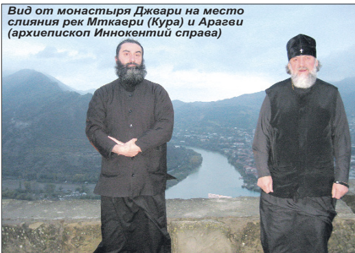
Вид от монастыря Джвари на место слияния рек Иткаври (Кура) и Арагуи (архиепископ Иннокентий справа)

о. Иосиф. - Там же мы осмотрели пантеон общественных деятелей, захоронения которых производились с 19 века. Начало этому положила вдова Александра Грибоедова - Нина. Надгробие Грибоедова - с трогательной надписью - очень красиво, а рядом находится и надгробие самой Нины, намного пережившей своего мужа.